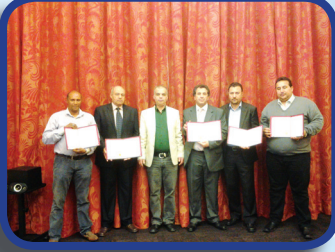
العلاقات العامة وتنظيم وإدارة المؤتمرات والمراسم ولأحتفالات الكبرى Public Relations, Organization & Management of Conferences, Ceremonies & Major Celebrations.