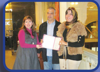
تمية المهارات القانونية والاستشارات لموظفي الإدارة القانونية Development of legal & advisory skills of the legal departments staff