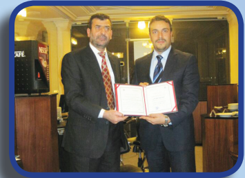
أحدث الممارسات في المشتريات وإمدادات الطلب على إدارة المخزون Latest practices of procurement, supply demand & inventory management

The Center, which has agreements with the finest American bodies and universities, ensures to adopt sharing certificates to acquire professional, distinctive, high competence and quality nature.