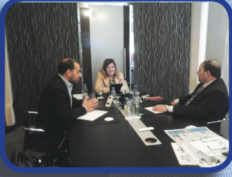
الإشراف الهندسي ومتابعة التنفيذ في المواقع Engineering Supervision & Following Up Pojects Implementations At Sites