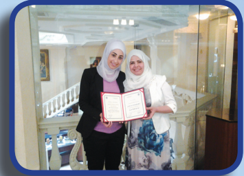
مهارات في الصيدلة السريرية Skills in clinical pharmacology

In addition to many of the institutions, bodies, public and private companies in all Arab countries.