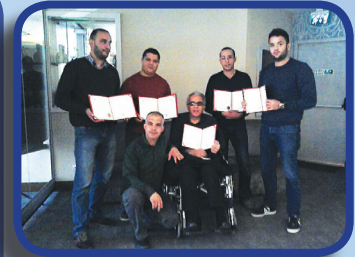
إدارة المشاريع الاحترافية Professional Projects Management (PMP)