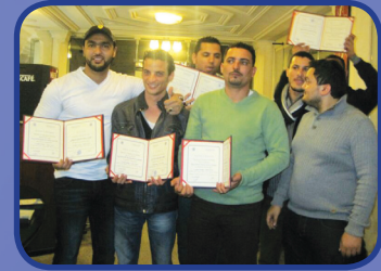
أمن نظم المعلومات Security of information systems

The center includes elite of trainers and consultants, who have scientific degrees, graduated of the highest domains of specialization, academic and scientific expertise in all scientific majors.