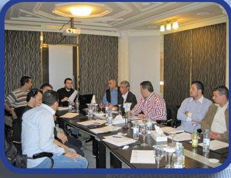
دور العلاقات العامة والإعلام في صناعة القرار والتأثير في الآخرين