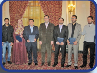
مهارات اجراء التحقيق الصحفي الاستقصائي والحوار السياسي ودور العلاقات العامة في التأثير على الرأي العام Skills of journalism investigations & political interviews & the role of public relations in influencing public opinion