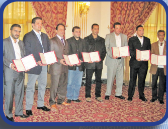
The Role of public relations and media in decision-making & influencing others